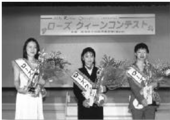
4月17日(土)に行われた本選大会後の女王

また、前橋市内・市外を問わず同年代の女性に対して、前橋で活躍できる可能性も感じてもらえるように、自分自身もこの一年間磨いていきたいと考えています。