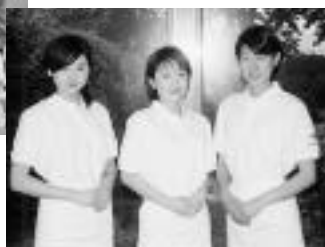
新ローズクィーン ▶